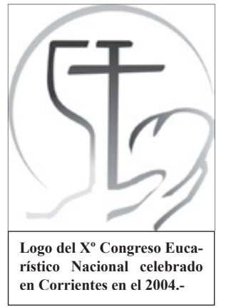
Logo del Xº Congreso Eucarístico Nacional celebrado en Corrientes en el 2004.-

Aparte de la oración la comisión se encuentra considerando las posibles sub comisiones y sus objetivos, cuestiones que se darán a conocer a medida que se vayan armando.